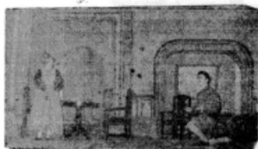
DON JUAN TENORIO

Esta previsto que ofrezcan un variado programa, con las mejores páginas de la música lírica. El marco de esta actuación será el Teatro Regio, y la fecha el día 7 de noviembre.