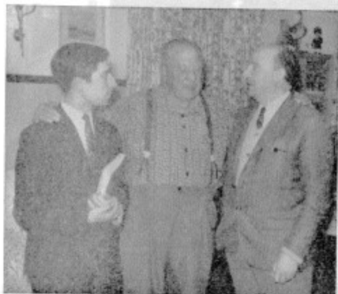
Esta foto de archivo nos muestra a los dos protagonistas a los que se refiere la carta. En tiempos en que sus relaciones eran más cordiales.