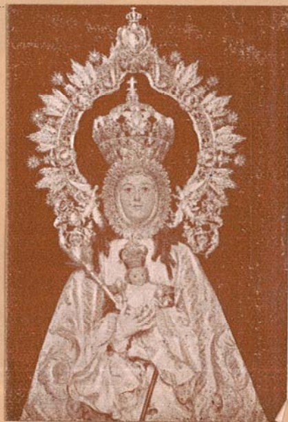
- MARÍA SANTÍSIMA DE BELÉN -