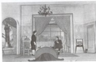
Una escena de la comedia. (TENEMOS PETRÓLEO)

Como si hubiera sido posible con alguna otra cosa aumentar la belleza, gracia natural y encantos de estas señoritas almanesas!. Y a los acordes de la Marcha Real se cerró el tradicional y solemne acto de su Presentación Oficial en público, yendo a ocupar, en majestuoso desfile y entre estrondosos aplausos, las plateas reservadas para presidir la última parte del Festival.