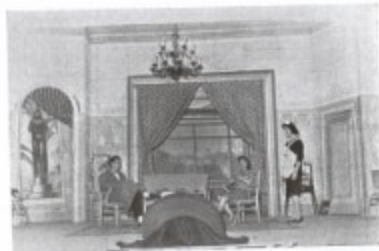
Otra de las escenas de la divertida comedia de F. Sevilla y Tejedor