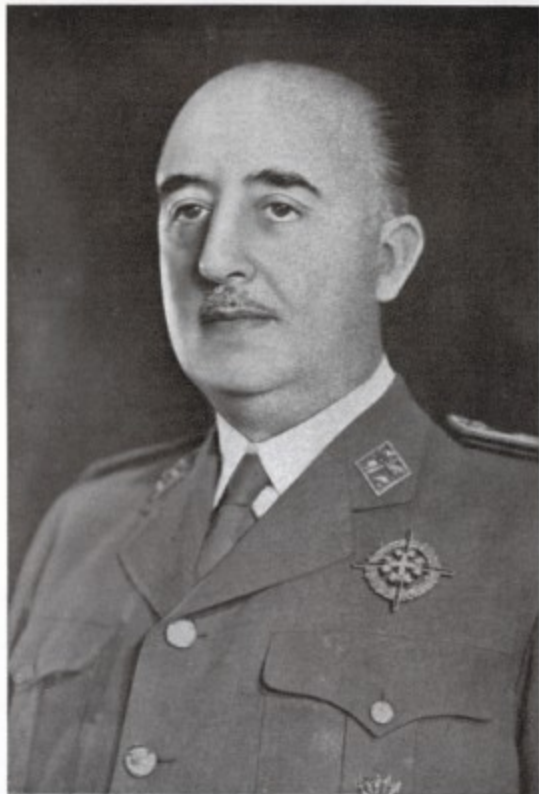
FRANCO CAUDILLO DE ESPAÑA