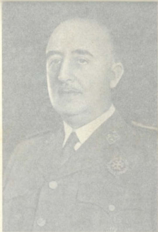
FRANCO CAUDILLO DE ESPAÑA