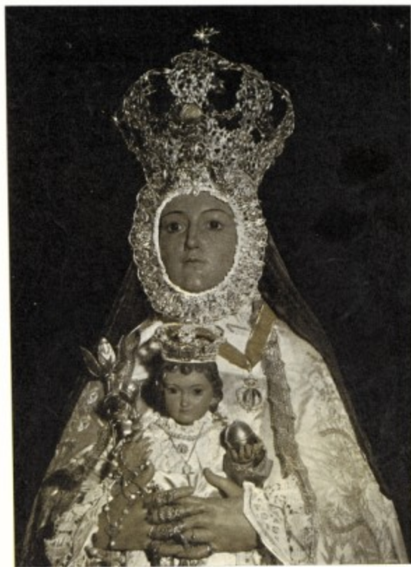
María Santísima de Belén