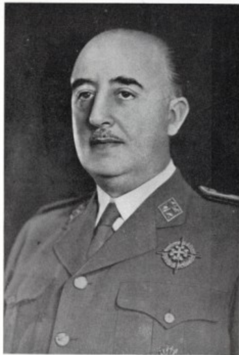
N. S. EL JEFE DEL ESTADO