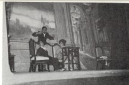
Una escena de la comedia en un acto «Inbón de mesa», de Chajar.