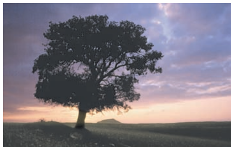
Amanecer en el encinar.