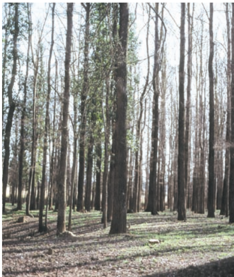
Chopera de la Casa de Ochoa, junto al Santuario de Belén.