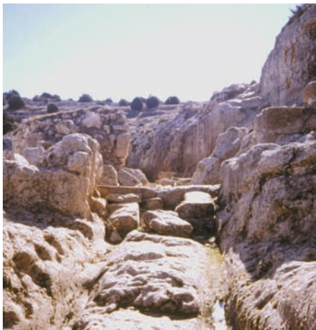
Camino tallado en la roca, que dá acceso a la ciudad íbera de Meca.

vestigios de una antigua civilización que pertenecen a una ciudad íbera denominada Meca, donde se han rescatado los restos de una torre romana, aljibes, viviendas, cerámica y un impresionante camino de carros excavado en la roca.