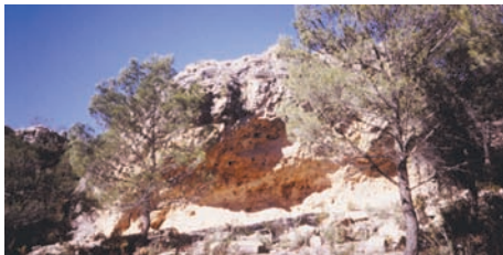
Cueva en el Cabezo del Moro.

de Yecla y la autovía Madrid-Alicante, limitando con Caudete, están las dehesas de Alcoy, Catín, Mojón Blanco y de Jódar.