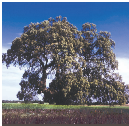
Encina en la dehesa de Botas.

El clima, mediterráneo de montaña, y la naturaleza del suelo, donde predominan las rocas de tipo calizo, van a condicionar el tipo de vegetación. Abunda el pino carrasco, que es sustituido por el pino negral en las zonas más altas y umbrías. También aparecen manchas de encina, enebro y coscoja más esporádicamente y en las cotas más altas sabinas. Por debajo del sustrato arbóreo, se desarrolla el sotobosque de especies típicas del matorral mediterráneo, con gran variedad de plantas aromáticas.