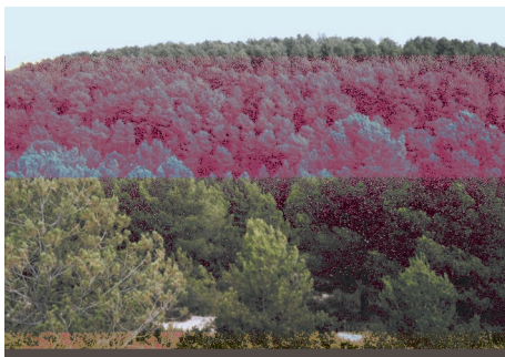
Pinada de la Sierra de Almansa

La zona noreste, conocida como Sierra de Almansa, se caracteriza por su altitud ya que se sitúa en ella el pico mas alto del término con 1.075 metros: el Pico Gallinero.