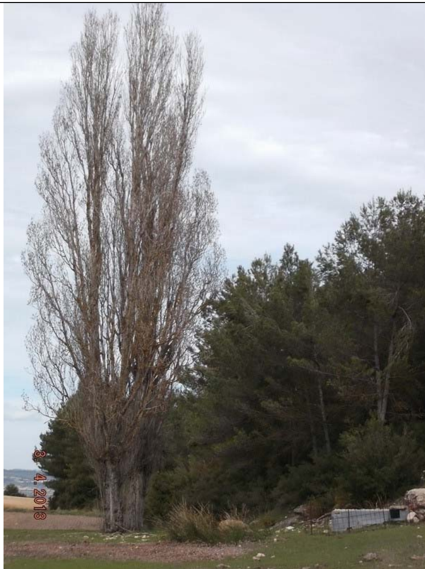
Fuente de San Pascual 5. Coscojar de Rhamno-Quercetum cocciferae .