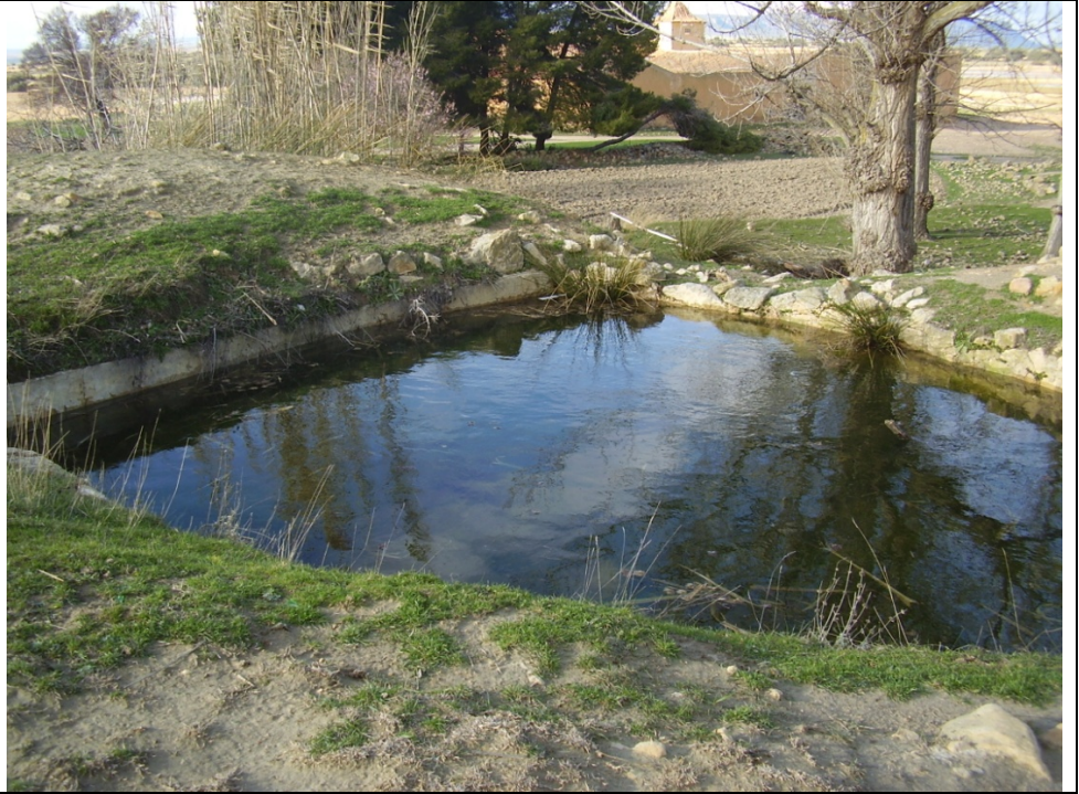
Fuente de Botas 3. Vista general del emplazamiento de la fuente (09-03-2013)