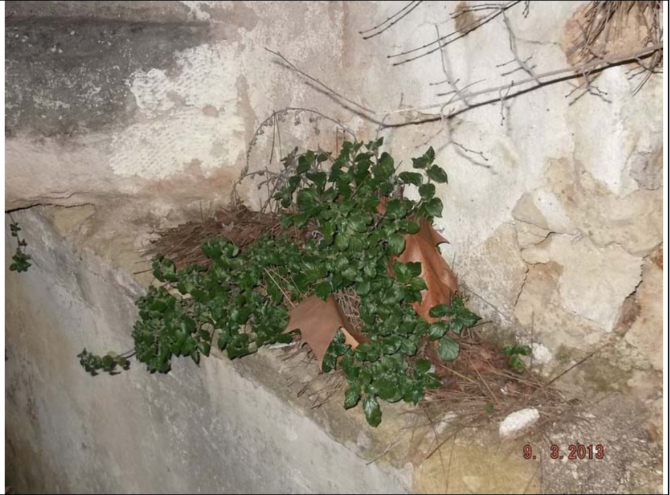
Fuente de Las Muñecas 5. Vista de la fuente rodeada de plátanos( Platanus x hispanica )